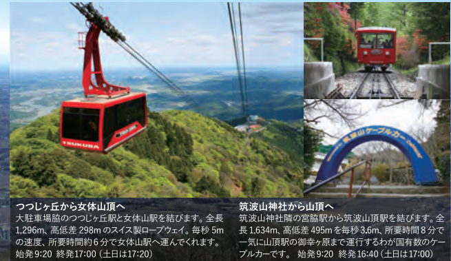
つつじヶ丘から女体山頂へ 大駐車場隣のつつじヶ丘駅と女体山駅を結びます。全長1,296m、高低差298mのスリム製ロープウェイ。毎秒5mの速度、所要時間約6分で女体山頂へ運んでくれます。始発9:20 終発17:00 (土日は17:20) 筑波山神社から山頂へ 筑波山神社隣の宮館駅から筑波山頂駅を結びます。全長1,634m、高低差495mを毎秒3.6m、所要時間8分で一気に山頂駅まで運行するわが国最大のケーブルカーです。始発9:20 終発16:40 (土日は17:00)

筑波山ホテル 青木屋 (パノラマ露天風呂「雲上の湯」が人気) 温泉センター つくば湯 (自然の中の露天風呂) つくば市筑波 753-1 TEL 029-866-0311 つくば市筑波 64-9 TEL 029-866-2983 筑波山ホテル (美肌をつくるアルカリ性単硫黄温泉) 筑波山 江戸屋 (せせらぎの中の露天風呂) つくば市筑波 395 TEL 029-866-0521 つくば市筑波 728 TEL 029-866-0321