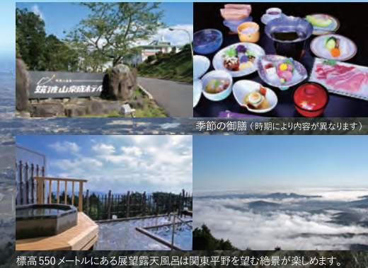
季節の御膳 (時期により内容が異なります) 標高550メートルにある展望露天風呂は関東平野を望む絶景が楽しめます。

筑波山温泉「美肌の湯」で、疲れを癒すショートトリップ 筑波山中腹の筑波山温泉は、アルカリ性単硫黄温泉で肌がすべすべになることから「美肌の湯」ともいわれています。日帰り入浴で小さな旅気分を味わってみませんか? 〒300-4352 茨城県つくば市筑波1(ロープウェイまで徒歩1分) TEL 029-866-0831 FAX 029-866-0847 E-mail: keisei@poppy.ocn.ne.jp