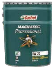
MAGNATEC PROFESSIONAL 0W-20 ハイブリッド車やアイドリングストップ車にも最適な省燃費オイル

◎優れた省燃費性を発揮すると共に、強い保護力によりATの劣化を抑制し、長期間にわたるATを快適な状態に保ちます。