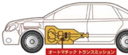
オートマチック トランスミッション

カストロール MAGNATEC PROFESSIONAL シリーズをおすすめする理由とは?