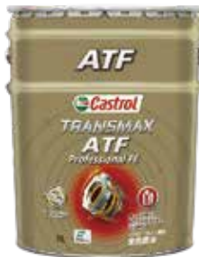
Transmax ATF Professional FE 独自技術と高品質の全合成油を採用した高性能ATF

◎優れた省燃費性を発揮すると共に、強い保護力によりATの劣化を抑制し、長期間にわたるATを快適な状態に保ちます。